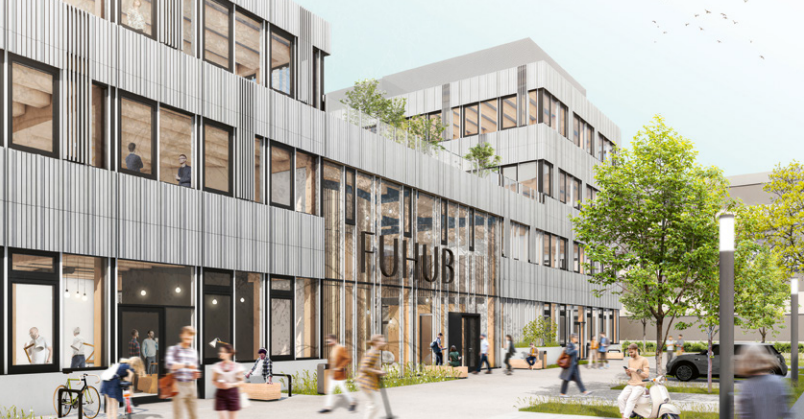
Das FUHUB verbindet modernste Büro- und Laboreinrichtungen