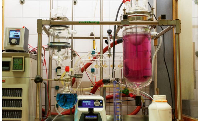
1- bis 5-l-Glasreaktor zur Herstellung und Verarbeitung chemischer Verbindungen unter kontrollierten Bedingungen